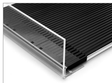
Acrylfront , Höhe 60 mm oder 80 mm. Materialstärke 3 mm. Zur Verwendung mit PRT-40 Profilschiene.

Rückwärtige Fixierung: Zur Befestigung der Gleitbahn-Endstücke im hinteren Regalbodenbereich empfehlen wir Ihnen unsere T-Profilschienen PRT-20 oder PRAB 10 (mit Abkantung) .