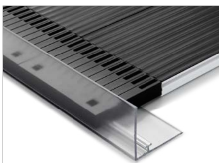
PRAU-39 Profilschiene mit Klebeband. Frontseitig mit Aufkantung, Höhe 39 mm.